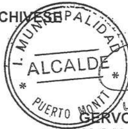
GERVOY PAREDES ROJAS ALCALDE COMUNA DE PUERTO MONTT